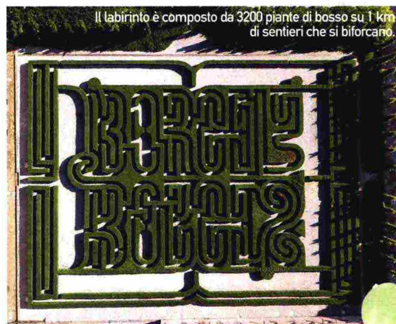
Il labirinto è composto da 3200 piante di bosso su 1 km di sentieri che si biforcano.